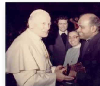
Gaben des Heiligen Geistes.

Er folgt mit großer Freude dem Aufruf des Heiligen Vaters in Rom zur Evangelisation der Welt und Erneuerung der Kirche. Seine Verkündigung des Evangeliums erfolgt in deutscher und englischer Sprache und wird andernorts simultan in mehrere Sprachen übersetzt. Seine Predigten wurden durch Medien verbreitet und seine geistlichen Hilfestellungen für ratlose Menschen werden vielen auch durch Bücher zugänglich gemacht. Individuen, Gebetsgruppen und Pfarreien erfahren Hilfe durch die ihm geschenkten